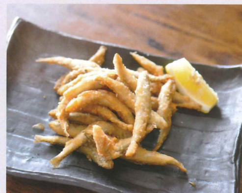
臭みや苦味が心配な場合は、お腹をつまんでファンを出し、塩で軽く揉みさつと洗います。

なことに、大正3年に茨城県の霞ヶ浦から卵をもらい、諏訪湖に放流したのが始まりです。今回はそんなワカサギを自分で釣って食べたいと思ひ、よく釣れると地元で評判の『民宿みなど』さんをお願いしてワカサギ釣りに挑戦してきました。 湖畔の民宿で受付を済ませ、宿のご主人が運転するボートに乗って諏訪湖に浮かぶドーム船とよばれる屋根付きの船へ。その日は小雨が降り肌寒い天気でしたが、ドーム船の中は雨も風もあたらしく快適でした。ご主人から竿や糸の扱い方・餌の仕掛け方などを学びます。餌となる生きた虫を小さな針に仕掛けるのは難しく、ご主人に助けられました。シーズン初めだったので、釣客は私の他に常連さん1人だけ。ご主人は常連さんに話しかけ、今日の釣れ具合を確認後、不慣れな私を気遣ってか「あつちのお客さん今日が初めてだ。ちよつとよろしく。」と私を託して宿に帰っていきま