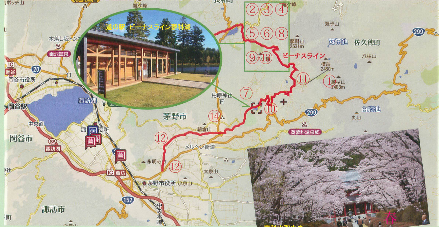
ピラタス蓼科スノーリゾート