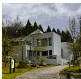
ミュージアム鉱研 地球の宝石箱 ホームページ